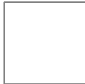
RECUADRO DE HUELLA DACTILAR